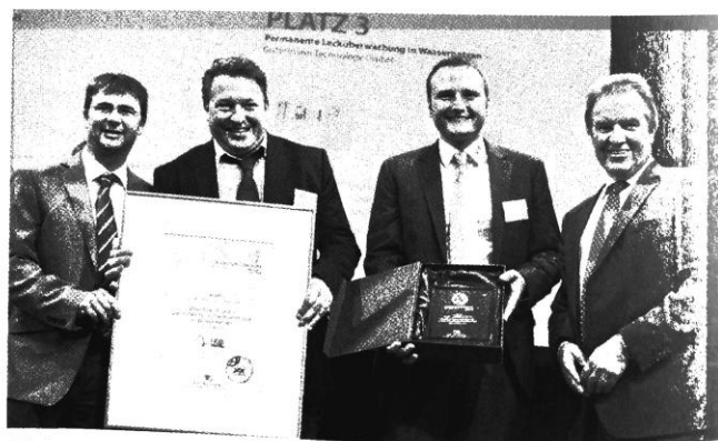
Bild 6: Preisübergabe in Stuttgart